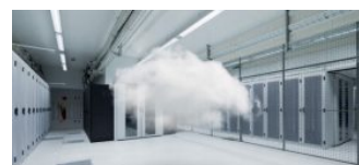
Конференция "Cloud Day 2016"