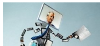
ПФР, Черкизово, Сибирская Сервисная Компания, Нордавиа, Allianz примут участие в конференции "СЭД/ЕСМ и EDI DAY"